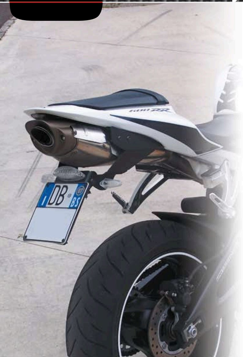
Photo Gallery Portatarga