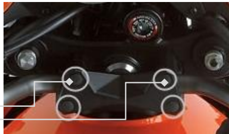
Photo 2 Screws to remove and replace