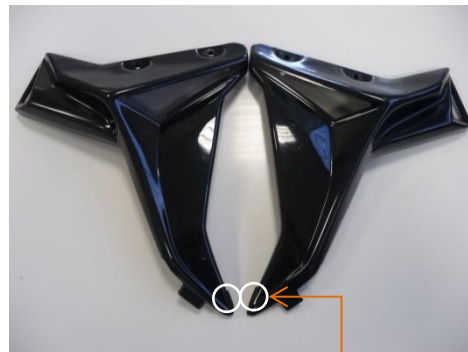
Position du joint