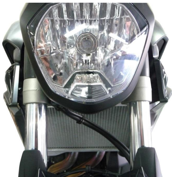
Montage conforme : écopes alignées