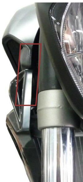
Ecopes non alignées