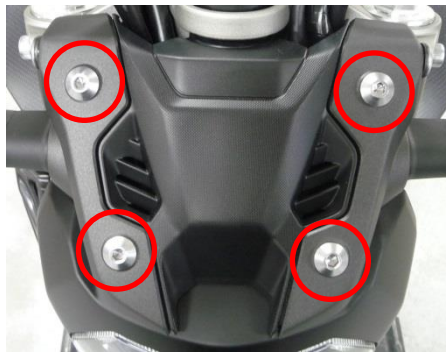
Vis d'origine à démonter.